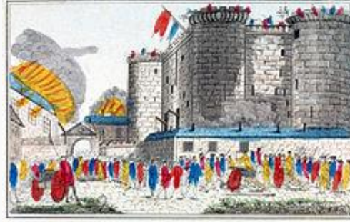
PRISE DE LA BASTILLE Par les Citoyens de Paris assistés de leurs braves M rs les Gardes Françaises le 14-Juillet 1789 Cette Bastille fut construite au commencement du règne de Charles V. Repris d'abord par Louis de France en 1670. Elle ne fut véritablement détruite qu'en 1793. Elle étoit un des premiers repaires des grands Seigneurs & fut détruite par les Français pendant la révolution qui étoit le Capitaine de son nom dans ce genre.