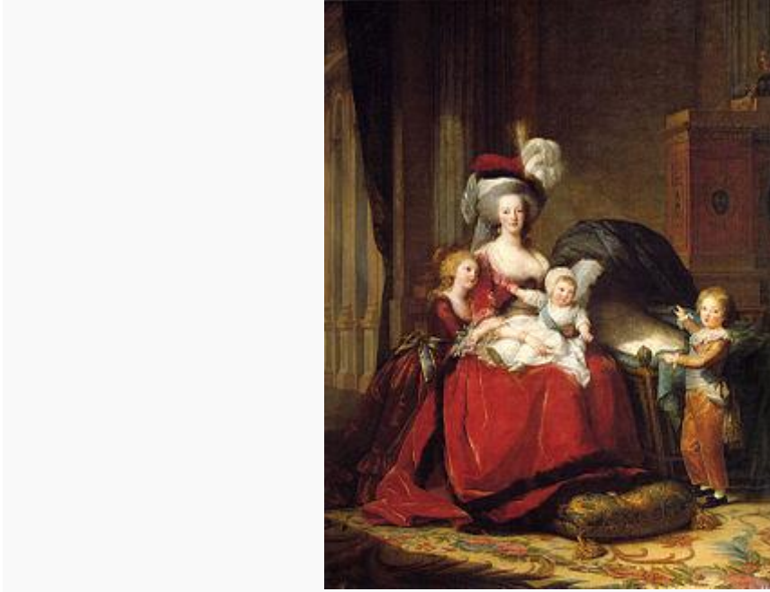
العائلة الملكية الفرنسية: الملكة ماري أنطوانيت وأولادها الثلاثة.

ارتقى لويس السادس عشر العرش في وسط أزمة مالية؛ كانت الدولة تقترب من الإفلاس والنفقات فاقت الدخل. السبب الرئيس للأزمة المالية، هو حرب السنوات السبع ، ومشاركة البلاد في حرب الاستقلال الأمريكية [11][12] . في مايو 1776 استقال وزير المالية بعد فشله في تطبيق إصلاحات؛ وعين إثر ذلك الغير فرنسي جاك نيكرو، مراقباً للمالية العامة من قبل الدائنين؛ ولم يحز لقب وزير لكونه بروتستانتيًا [13] . أدرك نيكرو أن النظام الضريبي الفرنسي يعرض الطبقات الأكثر فقرًا لعبءٍ ثقيل، بينما طبقة النبلاء وطبقة رجال الدين معفاة من الضرائب. عارض نيكرو زيادة الضرائب على عامة الشعب، واقترح فرض ضريبة على رجال الدين لاسيما على العقارات التي يديرونها سواء كانت كنائس أم أديرة أم غيرها من مؤسسات العمل الاجتماعي؛ والإنقاص من الامتيازات المالية للكنيسة الكاثوليكية التي كانت فرنسا تدعى «ابنتها البكر» [14] وهو ما كان برأيه كافيًا لحل مشاكل البلاد المالية، إذ يقلل من العجز بقيمة 36 مليون ليفر. كما اقترح نيكرو أيضًا وضع مزيد من القيود القانونية على الإنفاق العام في الجمعية الوطنية [13] .